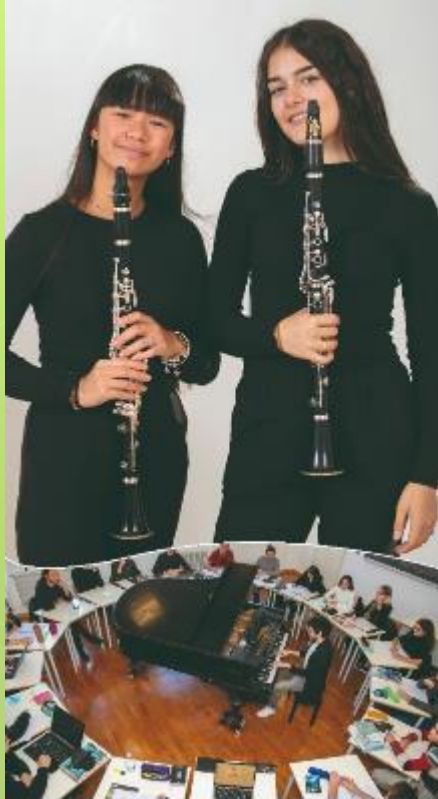
IL LICEO MUSICALE COREUTICO F. A. BONPORTI - TRENTO